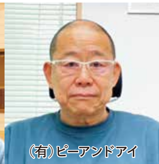
(有)ピーアンドアイ