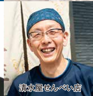
清水屋せんべい店