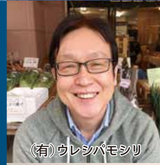
(有)ウレシパモシリ