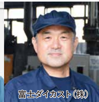
富士ダイカスト(株)