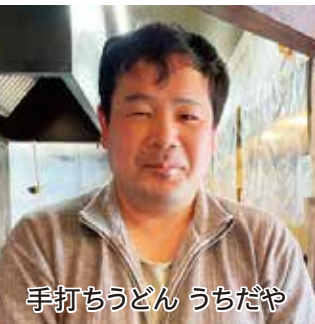
手打ちうどん うちだや