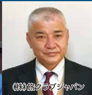
(株)旅クラブジャパン