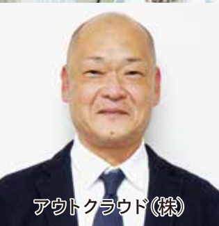
アウトクラウド(株)